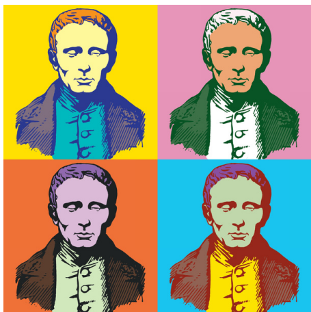
Visuel réalisé par l'association Valentin Haüy

Tout au long de cette journée de sensibilisation, différents stands seront présentés aux visiteurs : un atelier de braille musical, une exposition de livres adaptés, à appréhender l'autonomie d'une personne déficiente visuelle grâce à des maquettes tactiles et divers objets accessibles du quotidien, et à vous déplacer avec des lunettes de simulation.