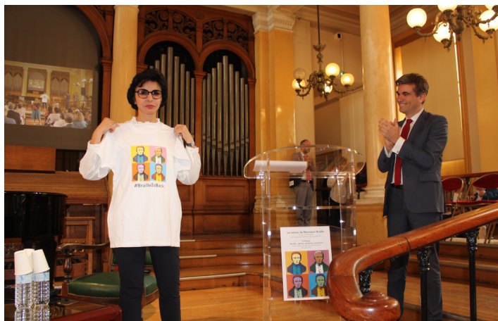
Colloque le 22 juin 2022, à l'occasion du 70 e anniversaire de la panthéonisation de Louis Braille à l'INJA.

Cette journée se clôturera à 18h15, par la projection de " Louis Braille, un génie 6.0 ", réalisée par Hélène JOUSSE , un épisode d' A Vous de Voir , émission de France 5, qui vous permettra de revivre les temps forts de la commémoration de la panthéonisation de Louis Braille, le 22 juin 2022.