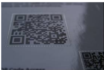
QR code facilement repérable par son contour en relief

Toute action visant à informer par des moyens divers autres que les moyens habituels est la bienvenue. Pour un restaurant par exemple, ce peut être l'édition d'un ou plusieurs exemplaires de la carte ou du menu en gros caractères, voire en braille. Par ailleurs, les nouvelles technologies apportent aussi des solutions utiles : informations lisibles sur tablette à partir d'un QR-code facile à repérer ( que le client pourra ensuite grossir sur sa tablette ) ou préenregistrées et pouvant être écoutées à partir d'un Smartphone.