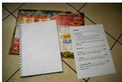
Menus en braille et en gros caractères

Toute action permettant à la personne de préparer sa visite est également bienvenue. Ainsi toute information disponible sur internet est utile :