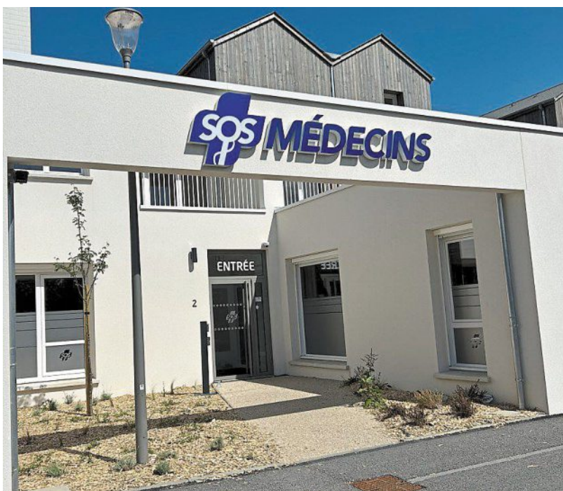
SOS Médecins dispose depuis le 1 er mars d'un troisième centre de consultations, au cœur du quartier du Chemin Vert, au nord de Caen.