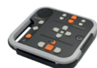
Victor Reader Stratus Humanware©

Totalement accessibles, ils sont très simples à utiliser.