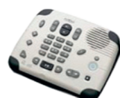
Plectalk PTN2 Plectalk©