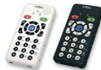
Plectalk© Pocket Linio